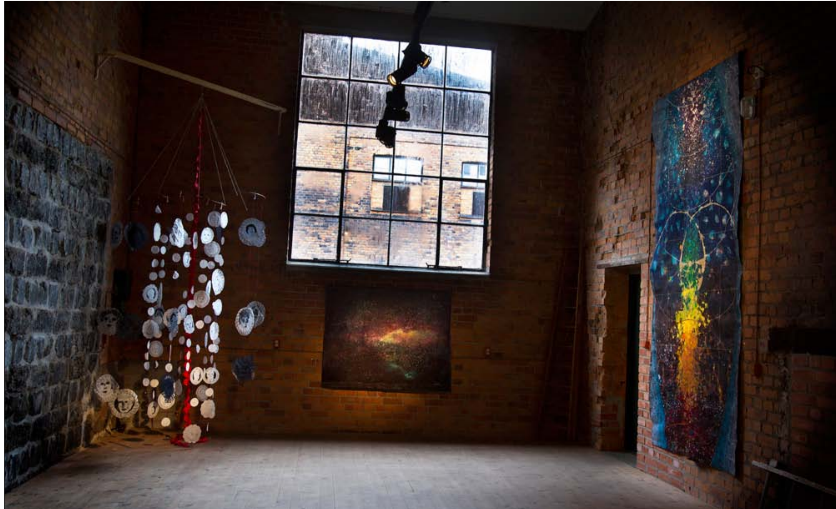
Ami Widahl ställer ut i en av järnverkets tegellokaler.